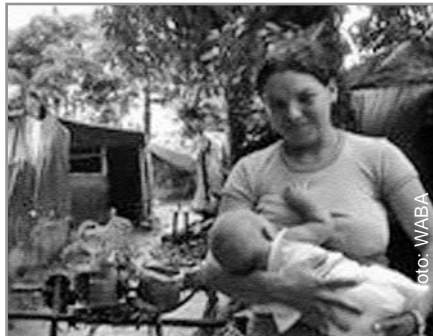
Deze vrouw verblijft in een nooddtentenkamp (fotowedstrijd WABA 2009)

Eerst en vooral: besef dat je een taak hebt, denk na over wat je kan doen, bereid jezelf voor en doe iets. Waar ter wereld je je ook bevindt, je kunt een rol spelen. Onwetendheid en onverschilligheid kunnen veel impact hebben... Laat ons hopen dat een verhaal zoals dit niet zich niet meer voordoet: